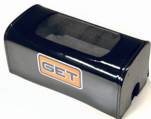
SUPPORTO PER MANUBRIO SENZA TRAVERSINO