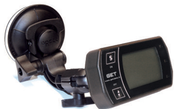
SUPPORTO SNODABILE A VENTOSA