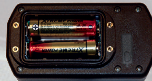
BATTERIE 2xAA E PORTA USB