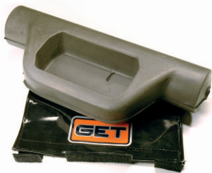
SUPPORTO PER MANUBRIO CON TRAVERSINO